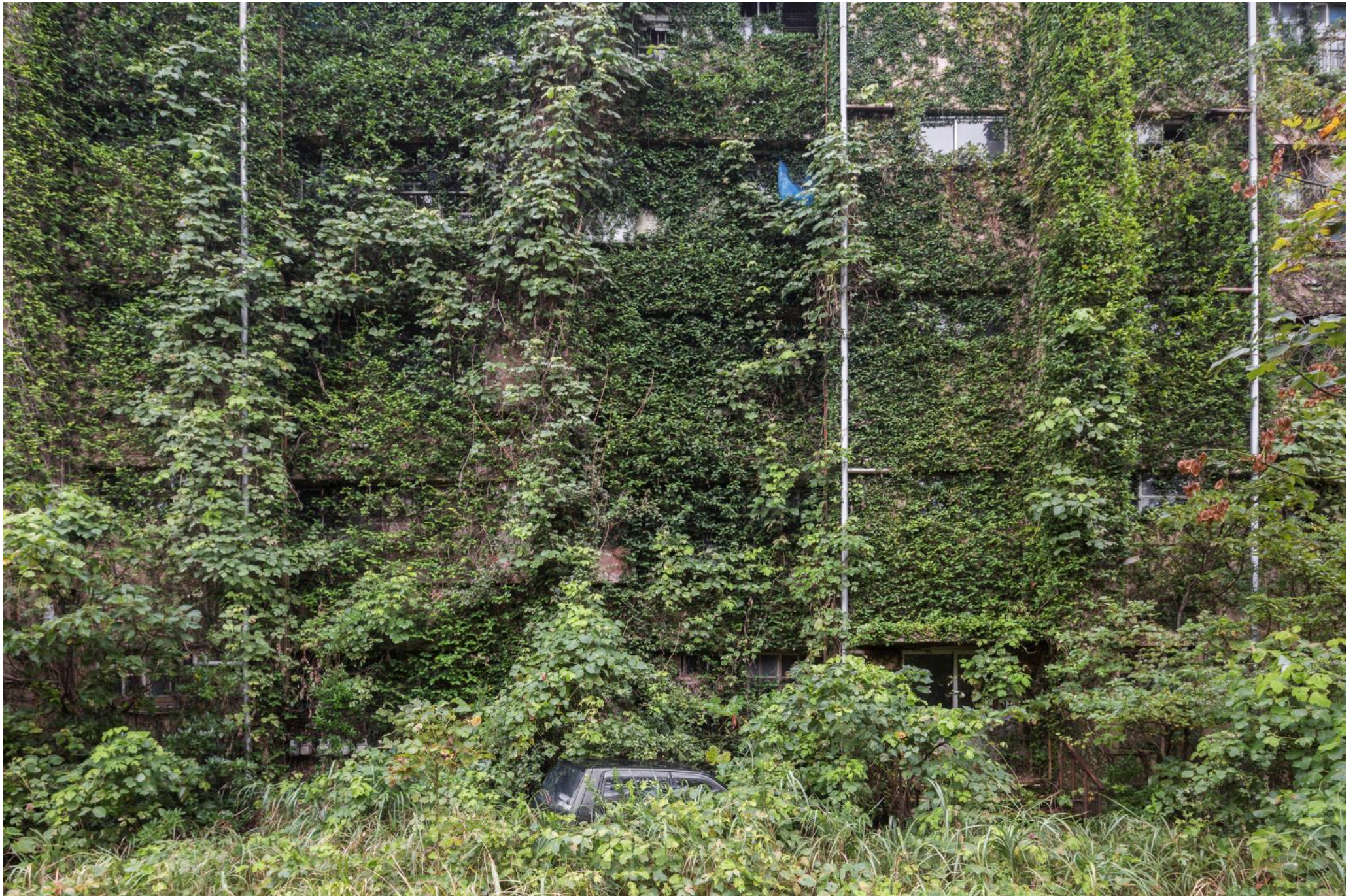
Immeuble d'habitation, Japon