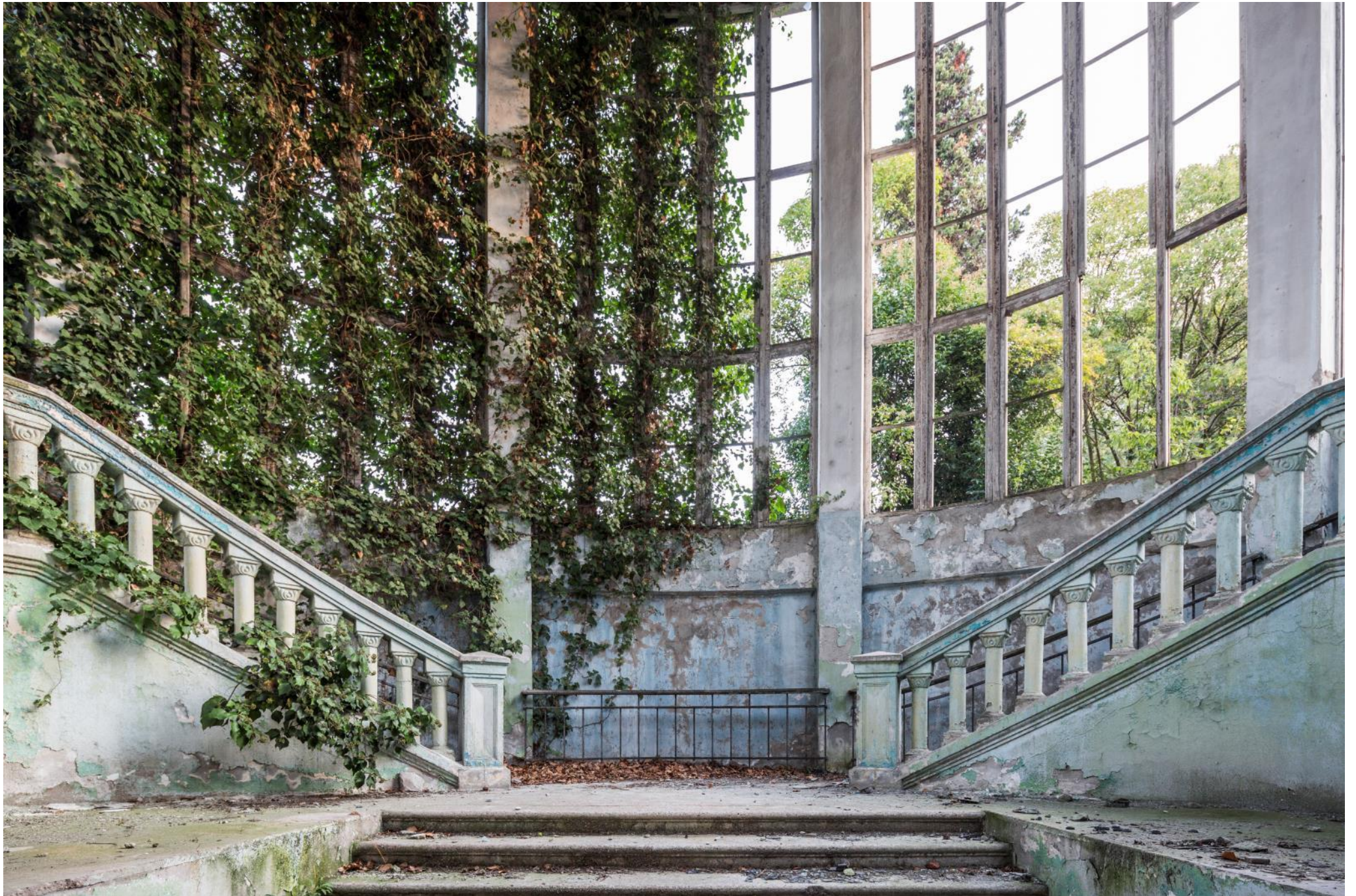
Immeuble d'habitation, Japon