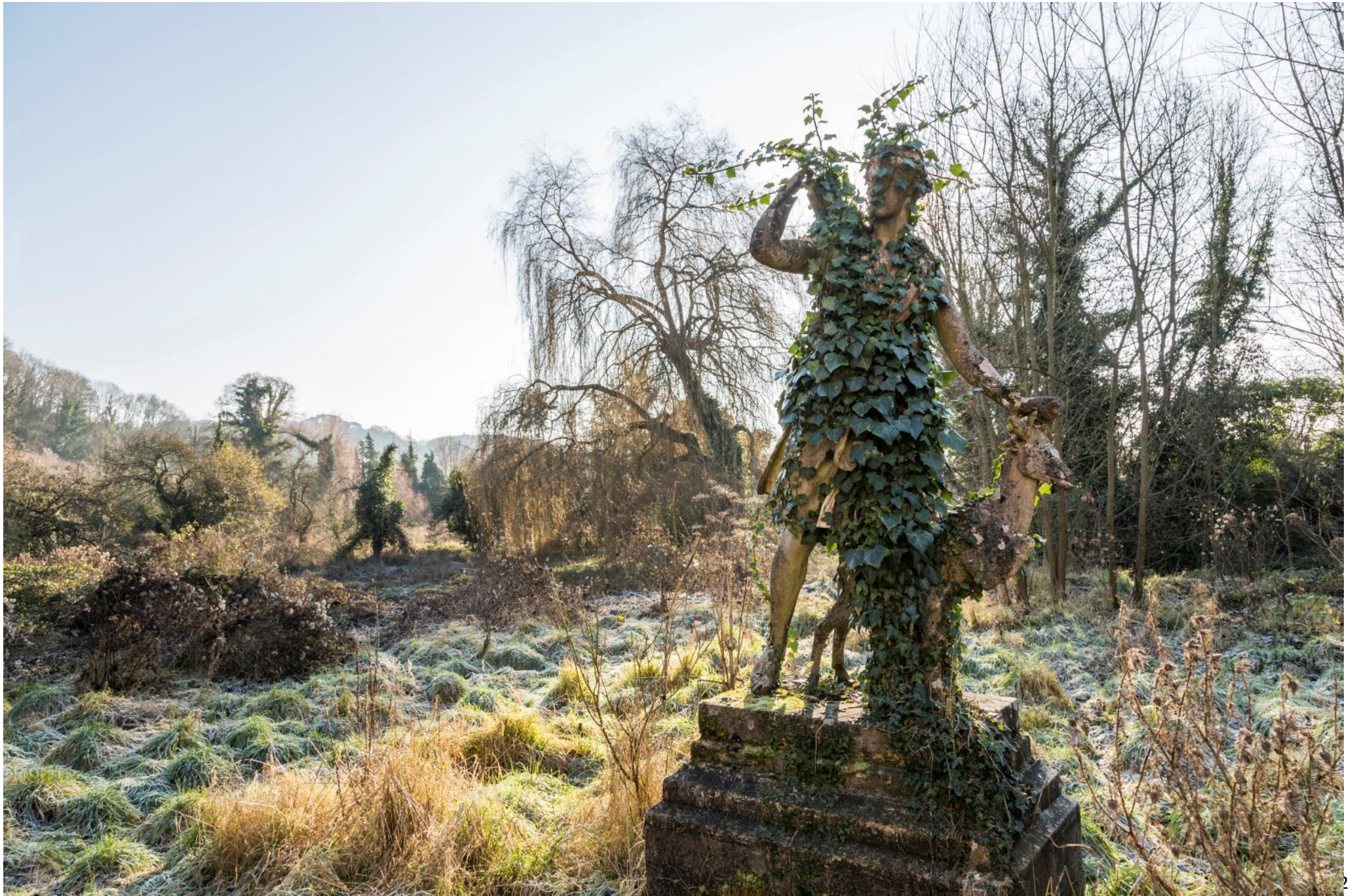
Parc d'un château, France