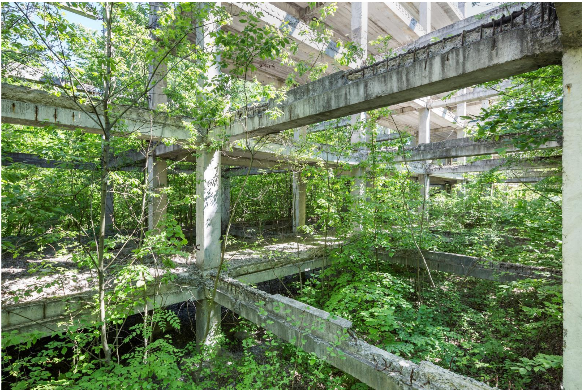
Construction inachevée, Moldavie