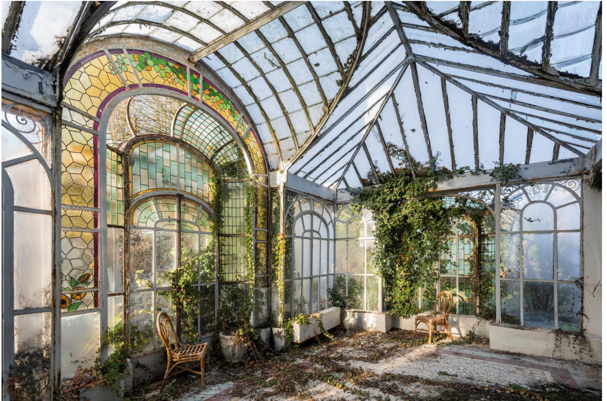
Jardin d'hiver, France