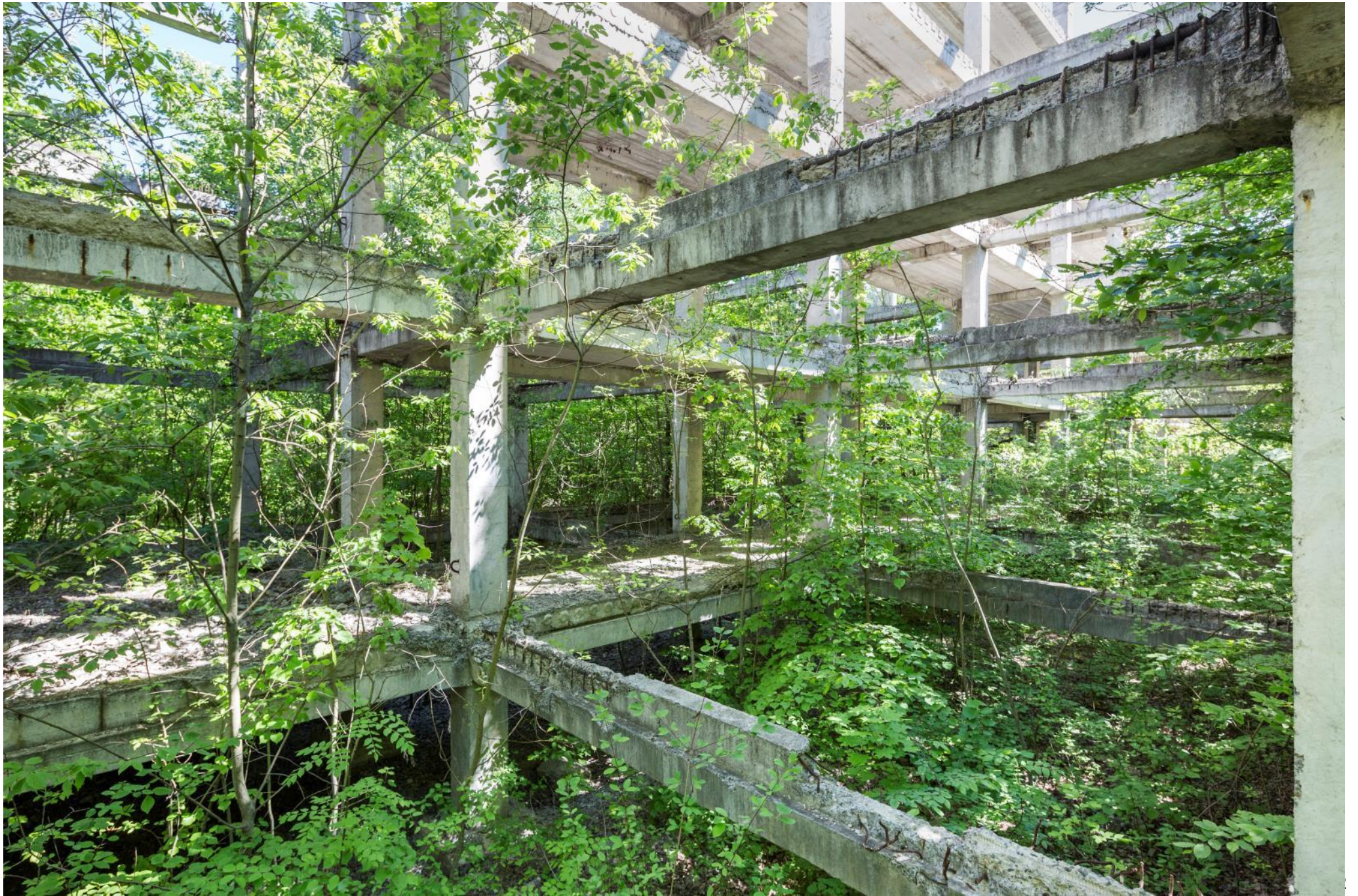
Construction inachevée, Moldavie