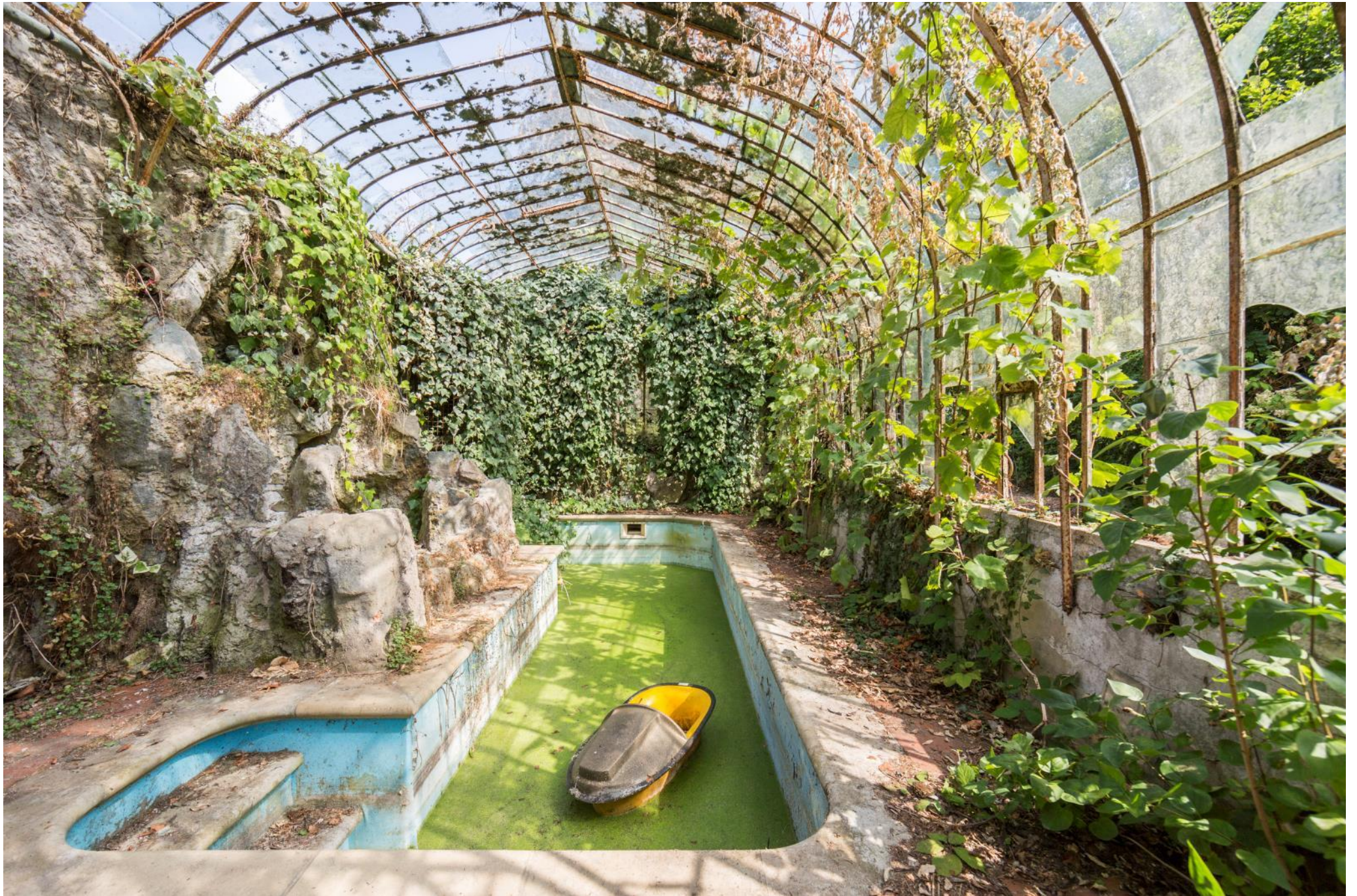
Jardin d'hiver, Belgique