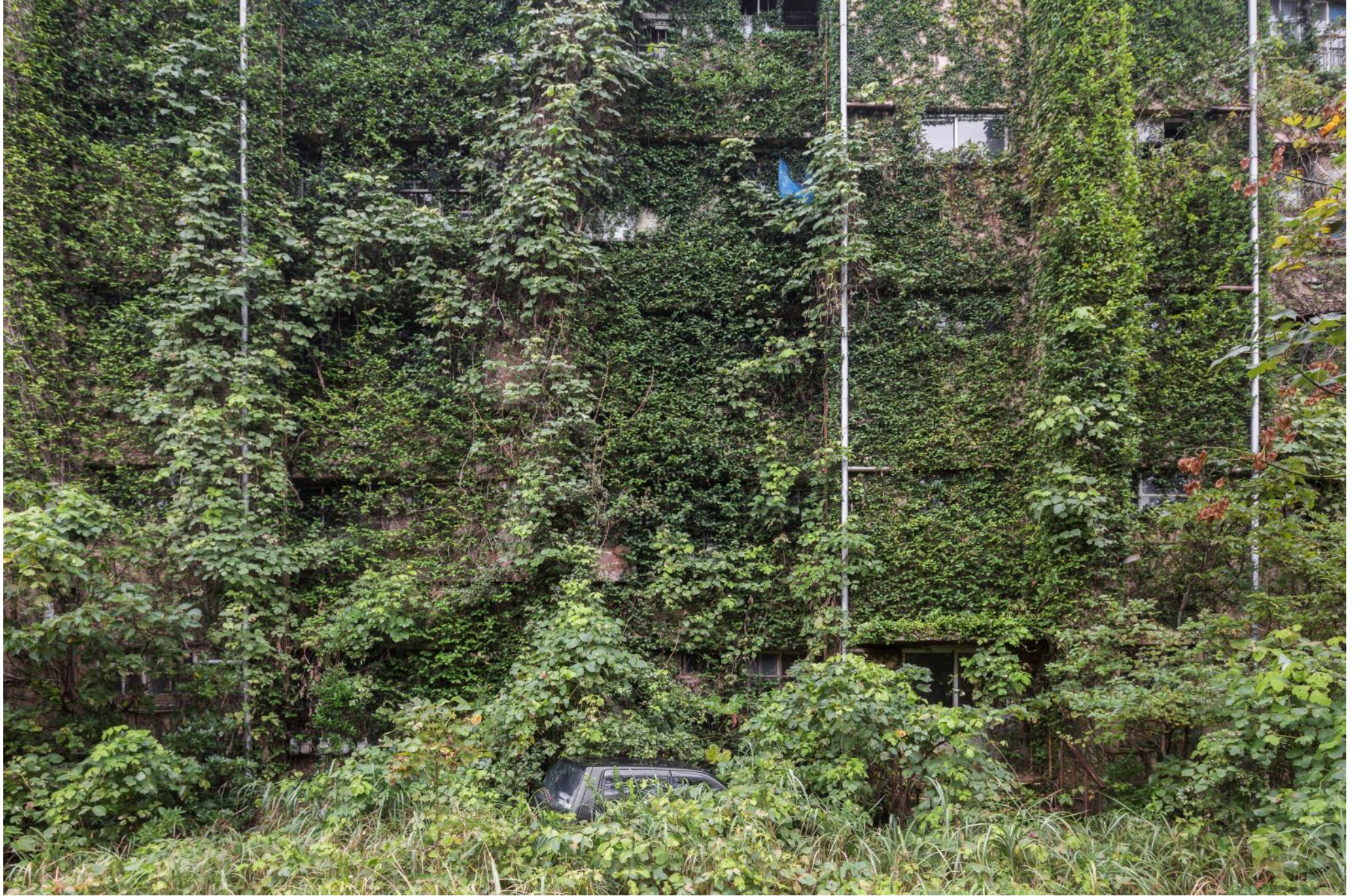
Immeuble d'habitation, Japon