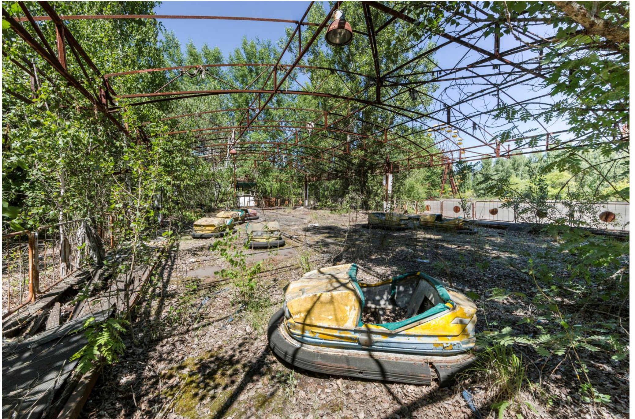
Parc d'attractions, Ukraine (Tchernobyl)